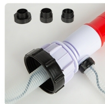
Установите подходящий адаптер для заливной горловины