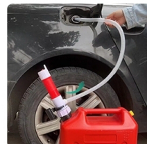
Вставьте заливной шланг в бензобак